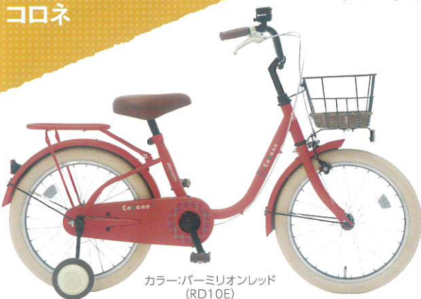
カラー:パーミリオンレッド (RD10E)