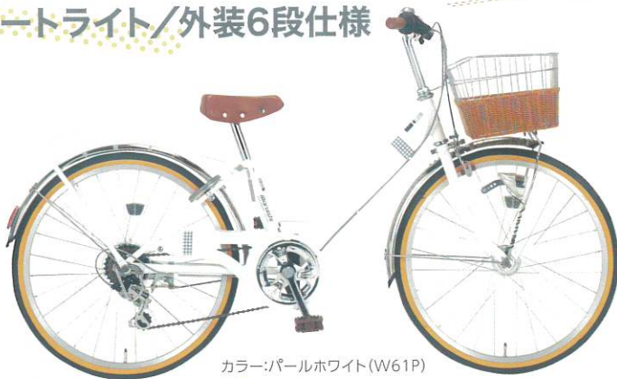
カラー:パールホワイト (W61P)