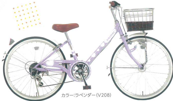
カラー:ラベンダー (V208)