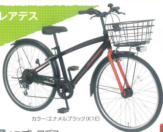
カラー:エナメルブラック(K1E)