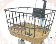
大人っぽくてかわいい籐風バスケット