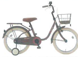
カラー:チョコレートブラウン (CH02T)