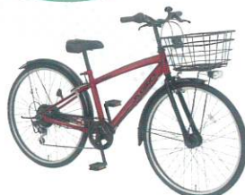
カラー:エナメルレッド(RD14E)