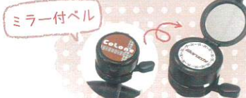
ミラー付のかわいいコンパクト型ベル