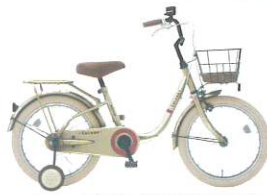
カラー:ブロンズチタン (T11M)