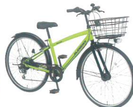
カラー:ライムグリーン(H62E)