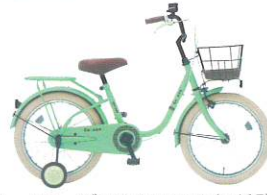
カラー:グレイッシュメント (H46E)