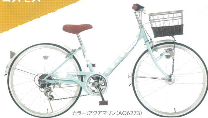
カラー:アクアマリン (AQ6273)