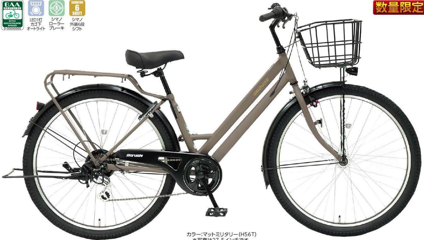
カラー:マットミリタリー(H56T) ※写真は27.5インチです。