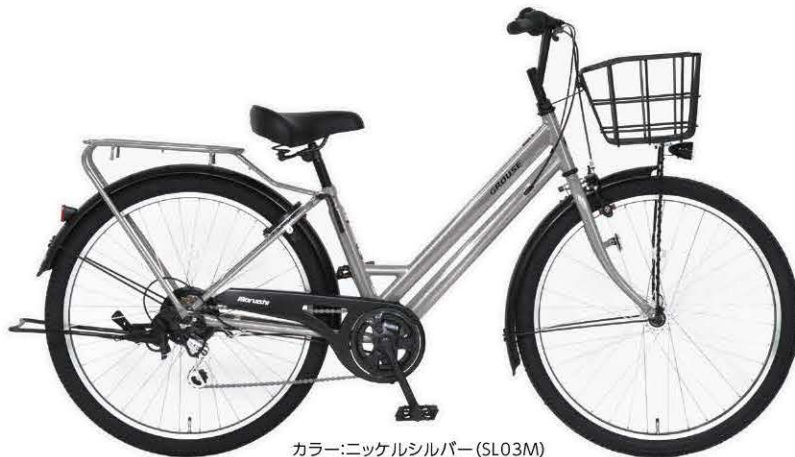
カラー:ニッケルシルバー(SL03M) ※写真は26インチです。