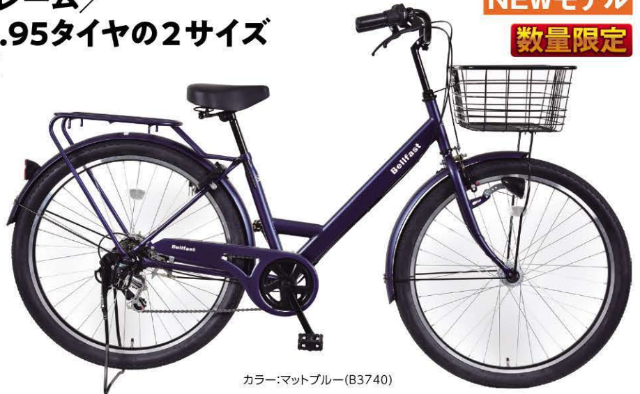
カラー:マットブルー (B3740)