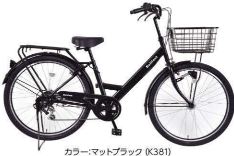
カラー:マットブラック (K381)