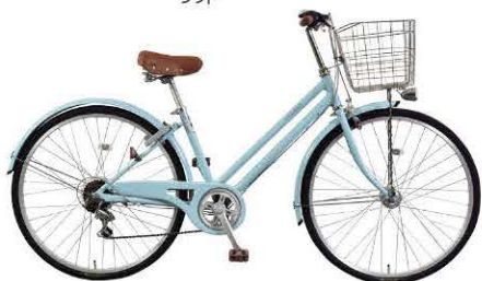
カラー:ソーダブルー (B5513)