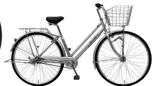
カラー:ニッケルシルバー (SL03M)