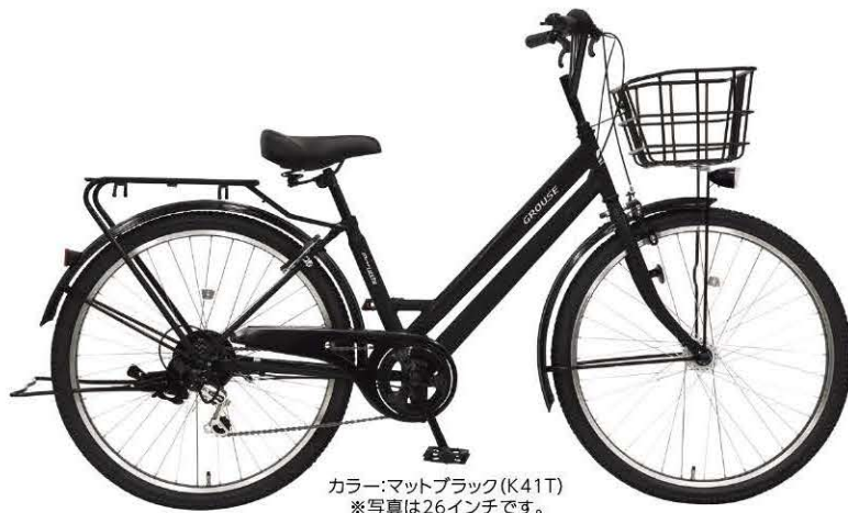
カラー:マットブラック(K41T) ※写真は26インチです。