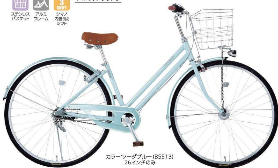
カラー:ソーダブルー (B5513) 26インチのみ