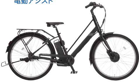
カラー:ハーフマットブラック(K65T)

オリジナルパイプキャリア 新規設計のパイプキャリア。直線的な構成でフレームに合わせたデザインになっています(最大積載重量:27kg)