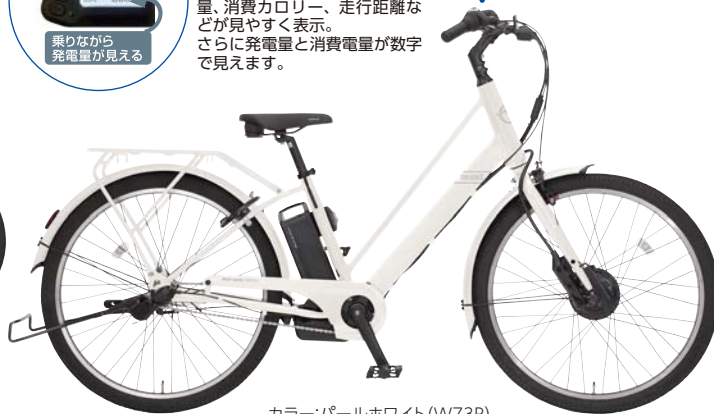
カラー:パールホワイト(W73P)