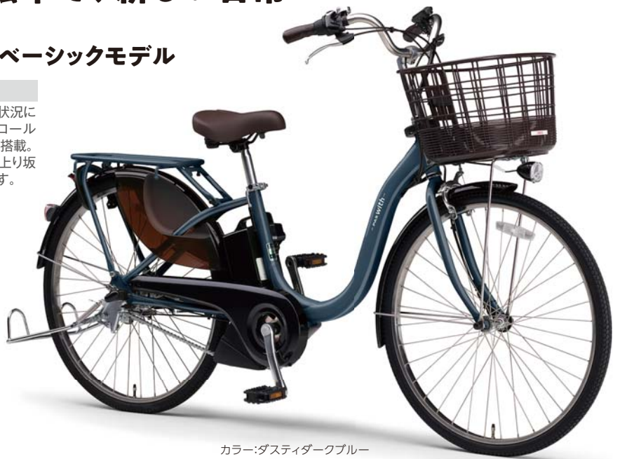
カラー:ダスティダークブルー