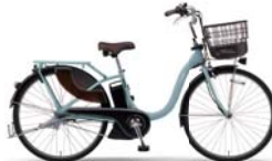
カラー:マットスキューブルー