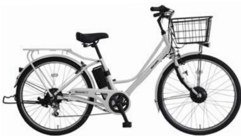
カラー:クールグレー (N14E)