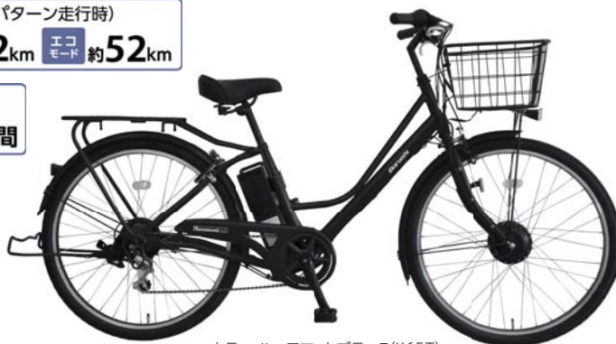
カラー:ハーフマットブラック(K65T)