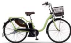
カラー:マットフレッシュグリーン 26インチのみ