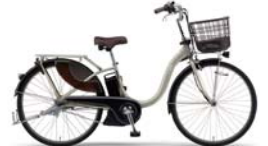
カラー:シャパンシルバー 26インチのみ