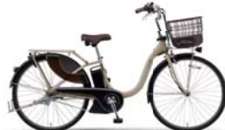
カラー:マットグレイッシュベージュ