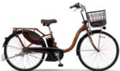
カラー:マットナチュラルブラウン