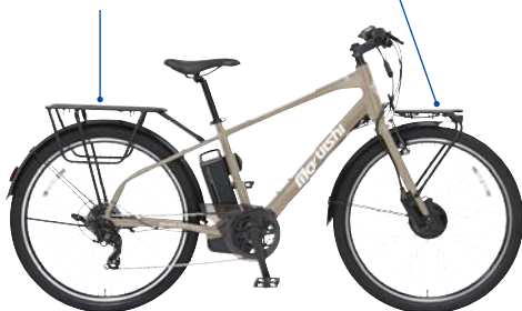
カラー:カシマヤゴールド(X16P)

バイクパッキングに最適なデザイン パニアバッグなど取付可能なキャリアやパッキングに適したダボを搭載