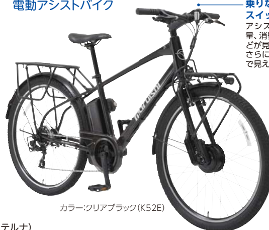
カラー:クリアブラック(K52E)

乗りながら発電量が見える スイッチパネル アシストモード、速度、電池残量、消費カロリー、走行距離などが見やすく表示。さらに発電量と消費電量が数字で見えます。