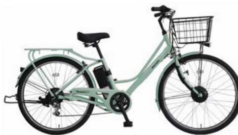
カラー:モスグレー (H89E)